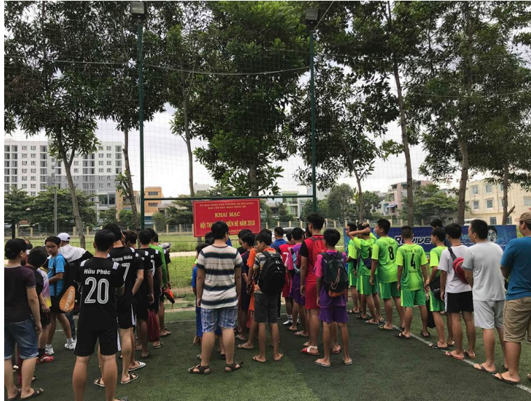
Bối cảnh mở đầu thể thao

Trong 02 ngày 25,26/8/2018 vì mục đích nâng cao tinh thần rèn luyện sức khỏe, to sân chi cho các em thi đấu nhân dịp hè, Ban chỉ đạo hè phường An Hòa đã tổ chức thi đấu thể thao thu nhập hè năm 2018.